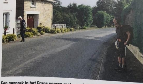
Een gesprek in het Frans voeren met een slechthorende oorlogsveteraan aan de overkant van de straat, dat is pas een uitdaging.