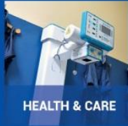
HEALTH &amp; CARE