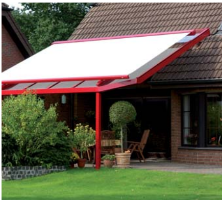
PERGOLEN UND WINTERGÄRTEN