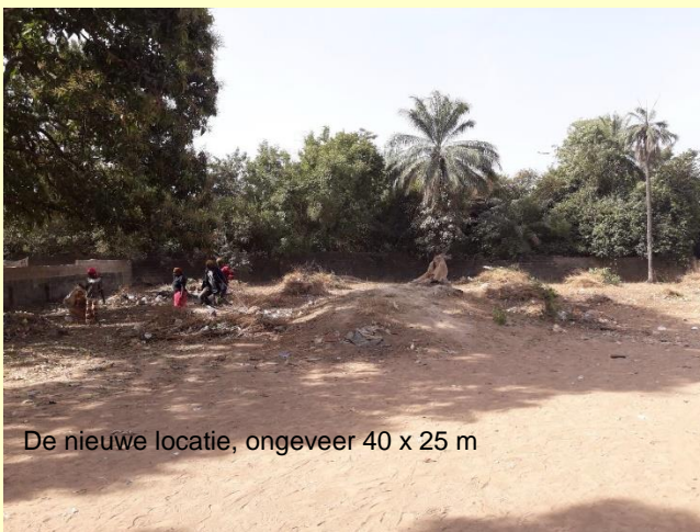
De nieuwe locatie, ongeveer 40 x 25 m

Sinds die week van vergelijken, onderhandelen, vergaderen en goedkeuring van de community oudste is er veel in gang gezet; zowel in Nederland als ook in Gambia!