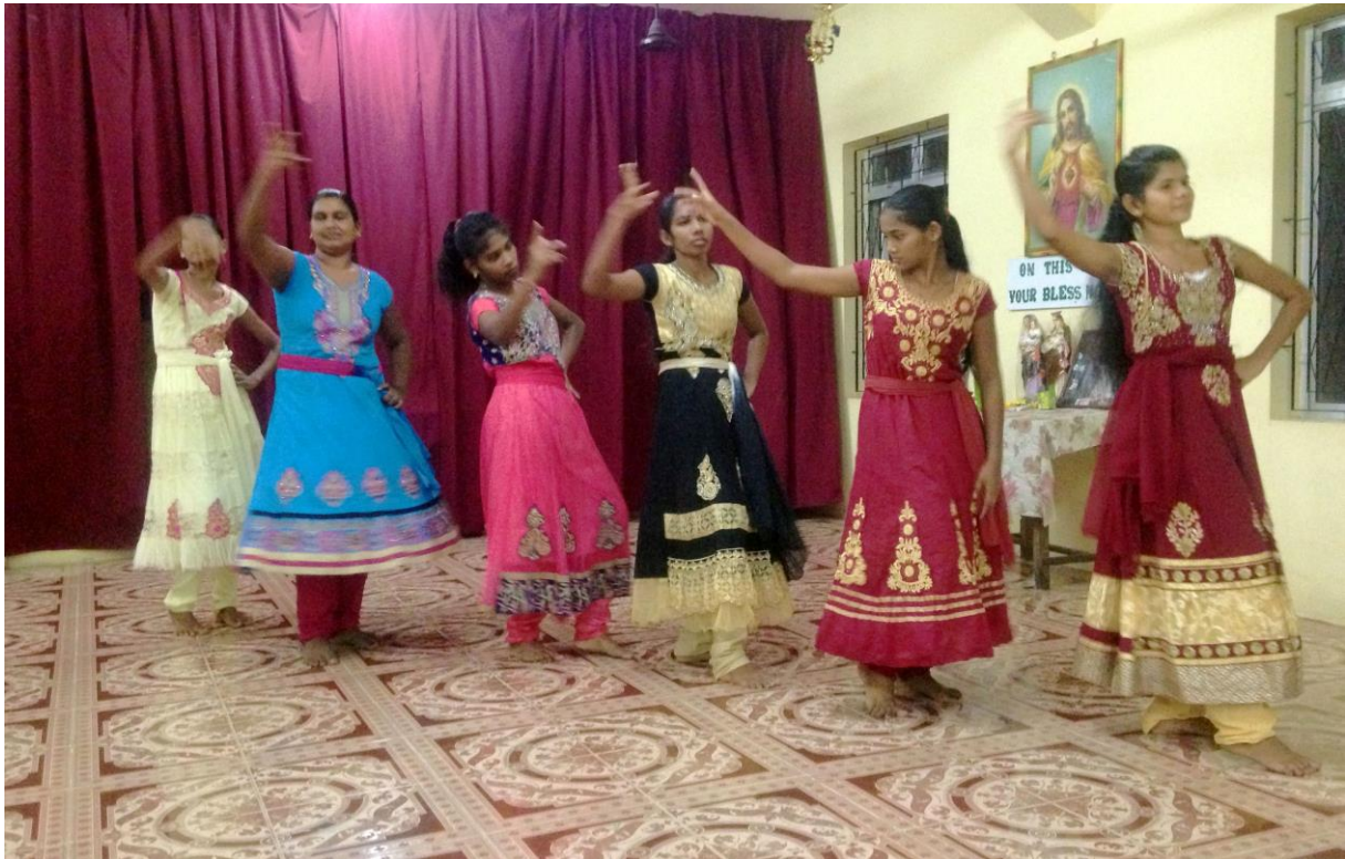
Dansvoorstelling in Akkuraipattu