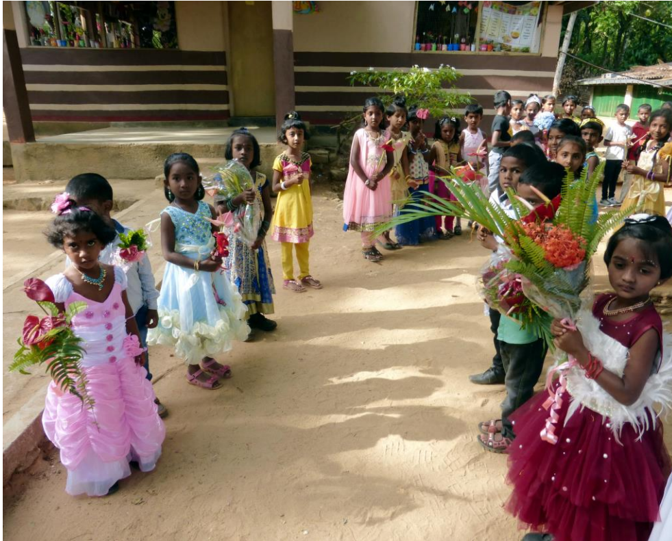
Welkom in Lunugala

Er is veel bereikt in 2017 wat projecten betreft. We kregen een aantal nieuwe schrijffouders en namen ook afscheid van enkele 'ouwe trouwe'. We hebben per 1 januari 2018 een secretaris als zeer welkome aanvulling van het bestuur. Onze inzet – hoe kleinschalig ook – helpt zichtbaar en daar doen we het voor.