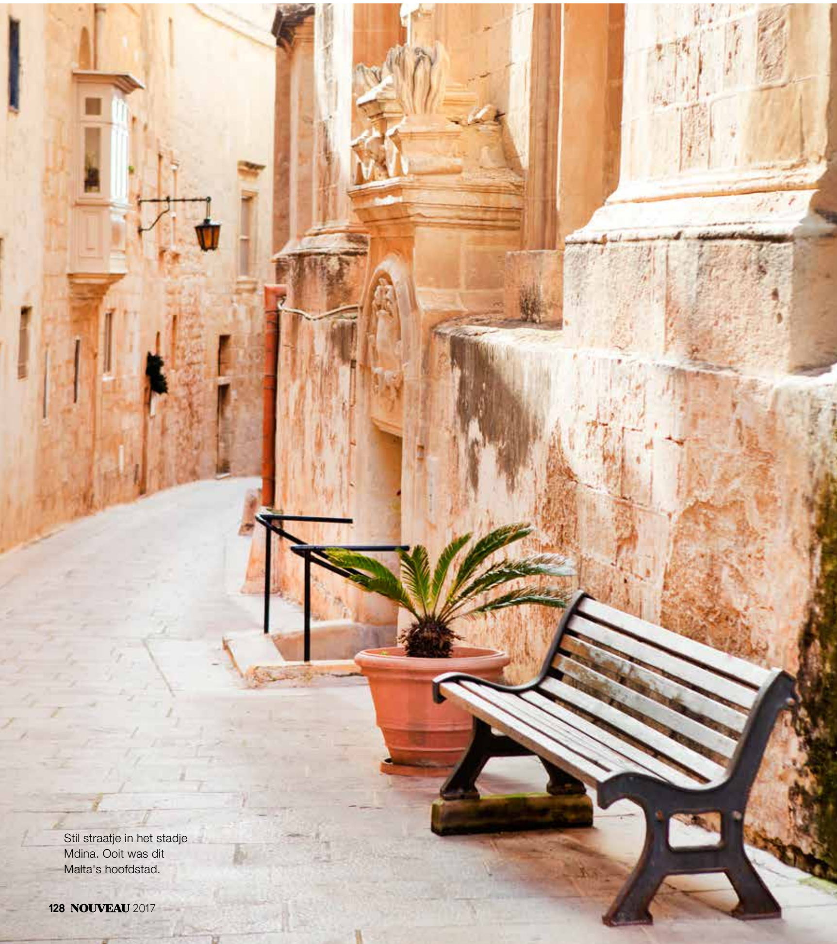
Stil straatje in het stadje Mdina. Ooit was dit Malta's hoofdstad.

TEKST: HARMKE KRAAK