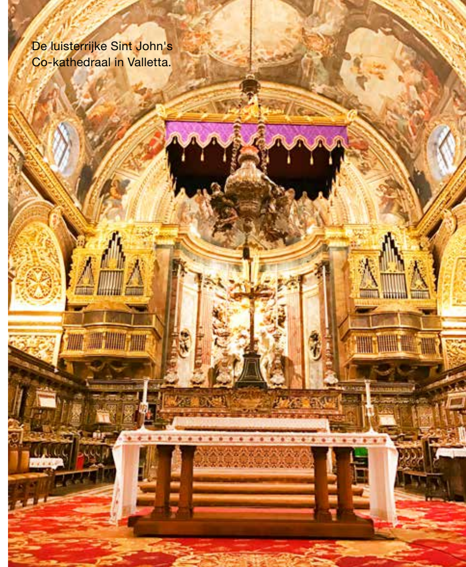
De luisterrijke Sint John's Co-kathedraal in Valletta.