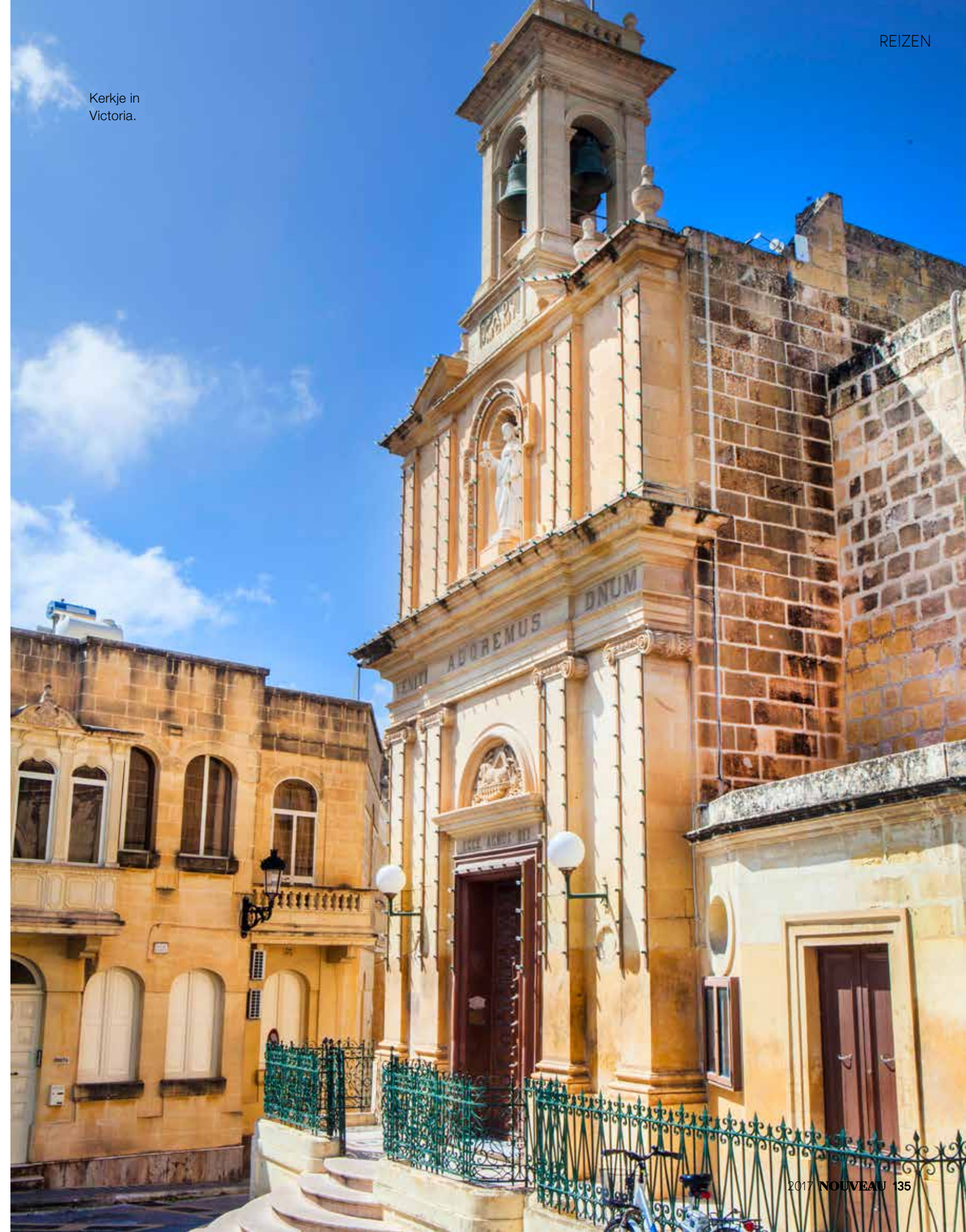
Kerkje in Victoria.

MET DANK AAN: AIR MALTA (WWW.AIRMALTA.COM) EN PUUR & KUUR (WWW.PUURENKUUR.NL)