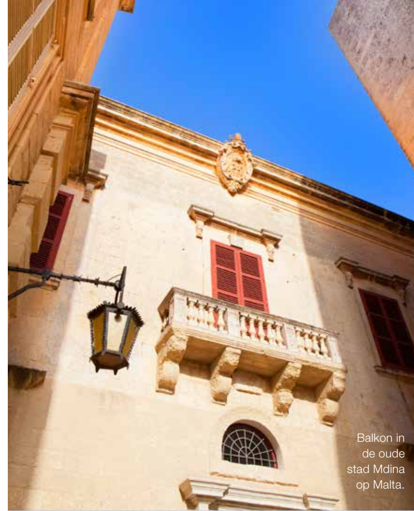
Balkon in de oude stad Mdina op Malta.

Er blijft gelukkig genoeg tijd over om Gozo te ontdekken. Dwejra Bay bijvoorbeeld, een rotsige baai waar je onder je voeten de fossielen van oeroude boomwortels voelt. De zee zelf is azuurblauw. Ik ontwaar hier een door rotsen omsloten water-