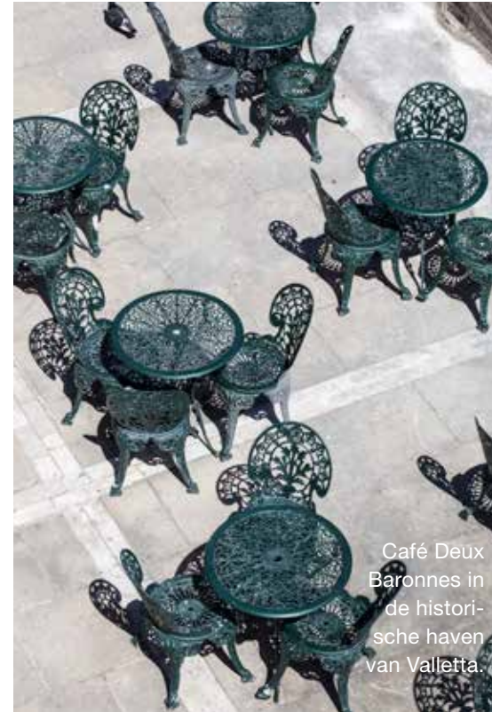
Café Deux Baronnes in de historische haven van Valletta.