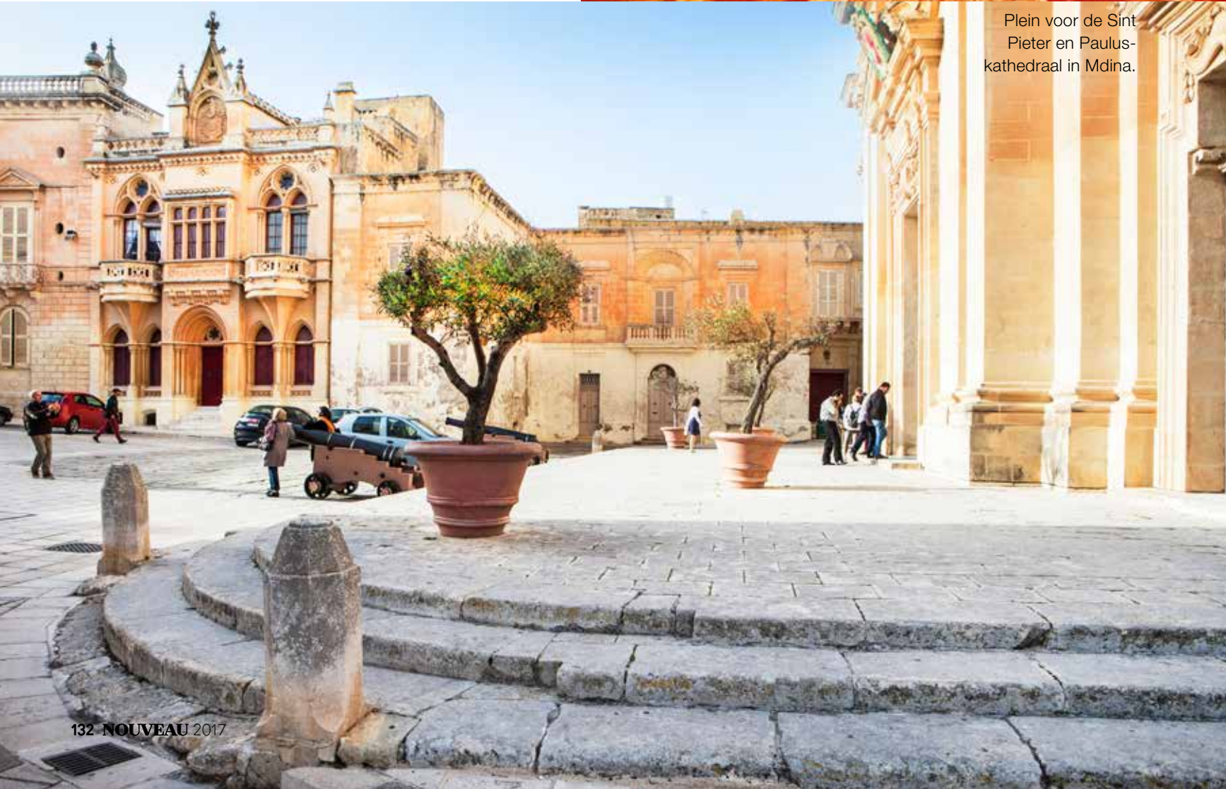
Plein voor de Sint Pieter en Paulus-kathedraal in Mdina.