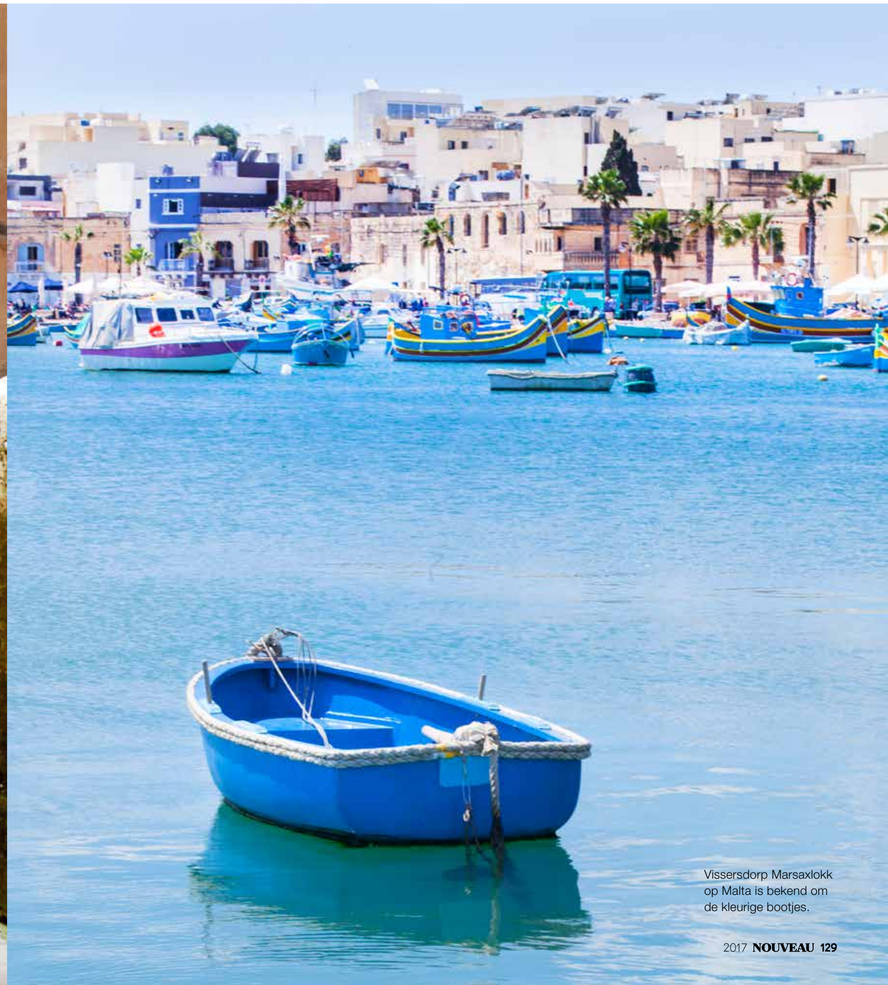
Vissersdorp Marsaxlokk op Malta is bekend om de kleurige bootjes.