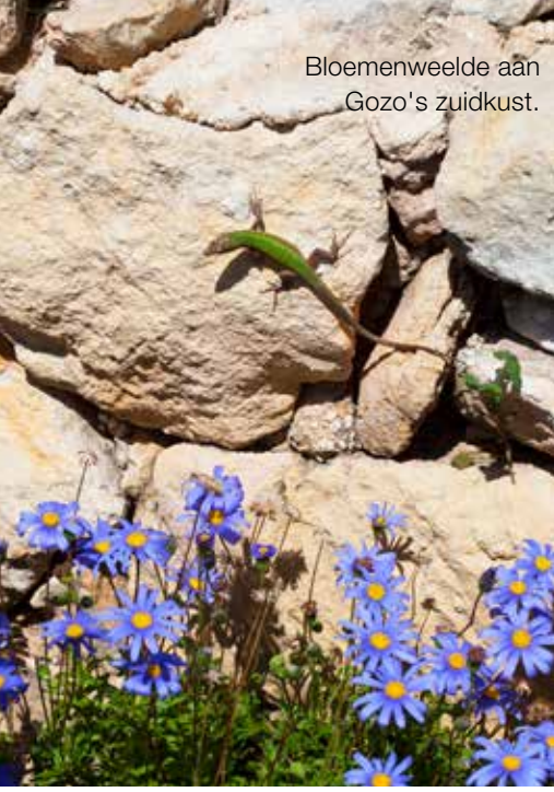
Bloemenweelde aan Gozo's zuidkust.