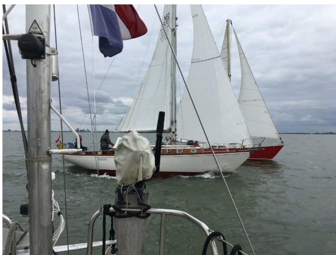
De Risban en de Tina bij de start.

Gedurende de wedstrijd nam de wind nog even toe tot zo'n 13-14 kt, maar over het geheel genomen was er 7-8 kt wind. Op de Risban werd met veel gedoe de spinnaker gehesen, waarbij ze hun bezem verloren. De bezem werd in de pauze weer opgespoord en aan boord gehaald.