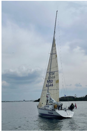
De Fenix alleen op de fok.