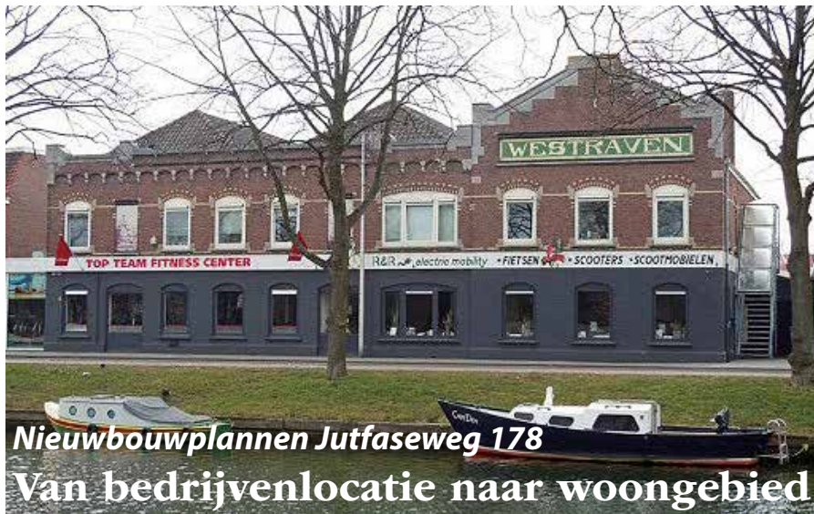
Het gebouw van tegelfabriek Westraven voorheen Ravesteyn.

Op de plek van de voormalige tegelfabriek Ravesteyn-Westraven aan de zuidzijde van de Jutfaseweg zullen op termijn woningen komen. De gemeente heeft het Intentieplan van ontwikkelaar MOZAIK goedgekeurd. De geplande bouw start naar verwachting in 2021.