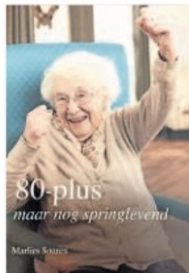
▲ Souren sprak voor haar boek met elf 80-plussers.

Aanleiding was het verhaal van een tante, die zichzelf op haar tachtigste een schildercursus cadeau gaf en daarna tot haar 95ste overtroden doorschielderde. „Daarbij behield ze een goed humeur en verkocht haar schilderijen elke keer op fancy fairs voor een goed doel. Als je nog kunt,